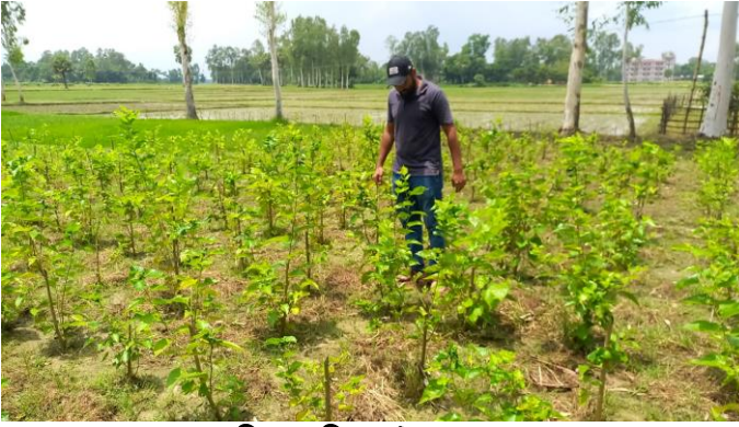
ফার্মিং পদ্ধতিতে তুঁত চাষ

বাংলাদেশে রেশম চাষে মাঝারী ও বড় উদ্যোক্তা তৈরির লক্ষ্যে ফার্মিং পদ্ধতিতে রেশম চাষ পদ্ধতি প্রবর্তন করা হয়েছে। ২০২১-২০২২ অর্থ বছরে চাপাইনবাবগঞ্জ, ভোলাহাট, নওগাঁ, রংপুর ও ঠাকুরগাঁও জেলায় ফার্মিং পদ্ধতিতে মোট ৩৯৬ বিঘা জমিতে তুঁতচারা রোপণ করা হয়েছে।