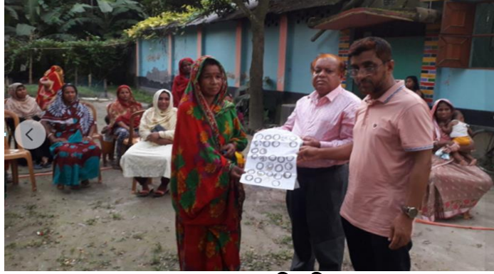
সম্প্রসারণ এলাকায় রেশম ডিম বিতরণ

সম্প্রসারণ এলাকার চাষীদের চাহিদার ভিত্তিতে প্রয়োজনীয় রোগমুক্ত ডিম উৎপাদন প্রক্রিয়ার অংশ হিসেবে পি১, পি২ এবং পি৩ পর্যায়ের বীজাগারসমূহে ডিম উৎপাদন কার্যক্রম প্রায় সারা বছর চলমান থাকে। ২০২১-২২ অর্থ বছরে বাংলাদেশ রেশম উন্নয়ন বোর্ডের বীজাগার সমূহে উৎপাদিত ৪.৬০ লক্ষ রোগমুক্ত রেশম ডিম রেশম চাষীদের মধ্যে বিনামূল্যে বিতরণ করা হয়েছে।