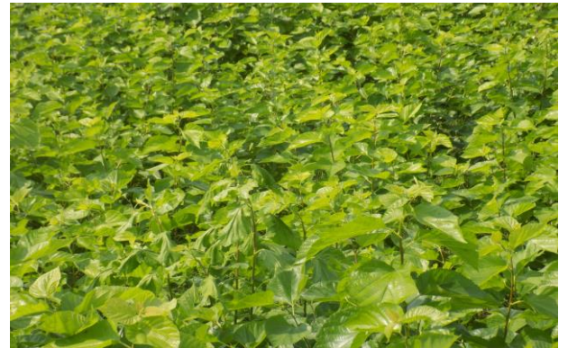
মীরগঞ্জ বীজাগারের তুঁতজমি