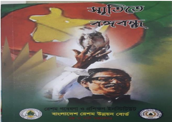
মুজিববর্ষ উপলক্ষ্যে “স্মৃতিতে বঙ্গবন্ধু” বইয়ের মোড়ক উন্মোচন

রেশম শিল্পের সম্প্রসারণের লক্ষ্যে এবং রেশম চাষীদের আরও বেশি সম্পৃক্ততা বৃদ্ধি করতে রংপুরে মুজিববর্ষ উপলক্ষ্যে রেশম চাষি সমাবেশ ও র্যালির আয়োজন করা হয় এবং রেশম চাষীদের আয় বৃদ্ধির লক্ষ্যে ৫০ জন চাষীর মধ্যে বিনামূল্যে চরকা বিতরণ করা হয়। বাংলাদেশ রেশম উন্নয়ন বোর্ডের মহাপরিচালক উক্ত চাষি সমাবেশে প্রধান অতিথি হিসেবে উপস্থিত ছিলেন।