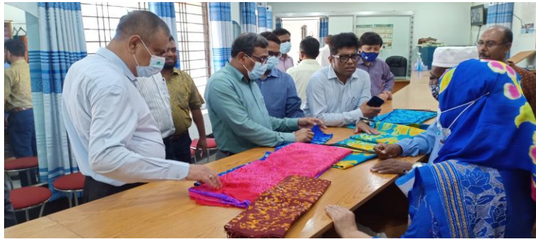
বস্ত্র ও পাট মন্ত্রণালয়ের সচিব মহোদয়ের রাজশাহী রেশম কারখানার শোরুম পরিদর্শন

রাজশাহী রেশম কারখানায় উৎপাদিত ব্লক, স্ক্রীন প্রিন্ট শাড়ী, গরদ শাড়ী, ডুপিয়ন সার্টিং, বলাকা, মটকা ইত্যাদি থান কাপড়, উত্তরীয়, টুপিস কাপড় রাজশাহী রেশম কারখানা চত্বরে অবস্থিত রেশম পণ্য বিক্রয় ও প্রদর্শনী কেন্দ্র রাজশাহী এবং জেডিপিসি চত্বর, ফার্মগেট, ঢাকা শোরুমে বিক্রয় করা হচ্ছে। ২০২১-২০২২ অর্থ বছরে রাজশাহী রেশম কারখানায় ১১,৮০৩ মিটার রেশম কাপড় উৎপাদন করা হয়েছে। উল্লেখ্য, ২০টি লুম বিশিষ্ট ঠাকুরগাঁও রেশম কারখানাটি লীজ চুক্তিতে দিয়ে চালানোর বিষয়টি প্রক্রিয়াধীন।