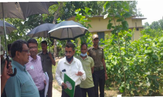
বস্ত্র ও পাট মন্ত্রণালয়ের সচিব মহোদয়ের মীরগঞ্জ বীজাগার পরিদর্শন

রেশম চাষীদেরকে তাদের প্রয়োজন অনুযায়ী রেশম ডিম সরবরাহের লক্ষ্যে রেশম পোকা (পলু পোকা) পালন করতে হয়। যেহেতু তুঁতপাতা হলো রেশম পোকার একমাত্র খাবার সেজন্য পলুপালনের জন্য প্রয়োজনীয় পরিমাণ তুঁতবাগানের রক্ষণাবেক্ষণ আবশ্যিক। সে লক্ষ্যে বাংলাদেশ রেশম উন্নয়ন বোর্ডের ৭টি তুঁতবাগান, ১১টি রেশম বীজাগার এবং ২টি গ্রেনেজের প্রায় ৪২০ বিঘা জমিতে সারা বছর তুঁতচাষ ও তুঁতজমি রক্ষণাবেক্ষণ করা হয়।