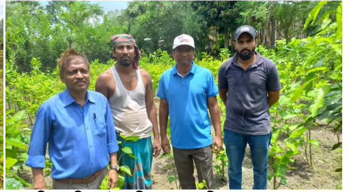
ফার্মিং পদ্ধতিতে তুঁত জমিতে রেশম চাষীর সাথে প্রকল্প পরিচালক