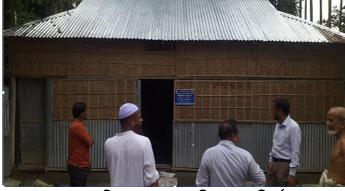
রেশমচাষীদের মধ্যে পলুঘর বিতরণ ও পরিদর্শন