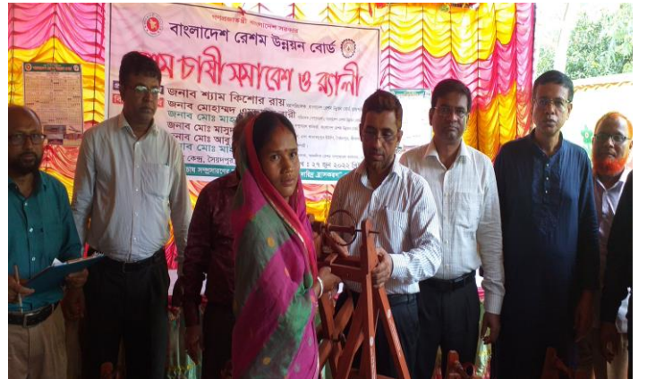
মুজিববর্ষ উপলক্ষ্যে রেশম চাষি সমাবেশ, র্যালি ও চরকা বিতরণ