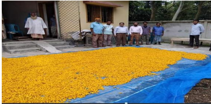
সম্প্রসারণ এলাকায় রেশমগুটি উৎপাদন

বাংলাদেশ রেশম উন্নয়ন বোর্ডের মাঠপর্যায়ের কর্মকর্তা/কর্মচারীদের সহায়তায় রেশম চাষীরা তাদের বাড়িতে বছরে চারবার রেশম পোকা পালন করে রেশম গুটি উৎপাদন করে থাকেন। ২০২১-২২ অর্থ বছরে রেশম চাষীগণ ২১৫ মেঃটন রেশম গুটি উৎপাদন করেছেন এবং উৎপাদিত রেশম গুটির একাংশ বাংলাদেশ রেশম উন্নয়ন বোর্ড ন্যায় মূল্যে ক্রয় করেছে এবং অবশিষ্ট অংশ বোর্ডের স্থানীয় কর্মীদের মধ্যস্ততায় বেসরকারি মিল মালিক ও কাঠঘাই মালিকগণের মধ্যে বিক্রয়ের ব্যবস্থা করা হয়েছে। বাংলাদেশ রেশম উন্নয়ন বোর্ড কর্তৃক ক্রয়কৃত রেশম গুটির মূল্য মোবাইল ফাইন্যান্সিয়াল সার্ভিস এর মাধ্যমে সরাসরি চাষীদের মধ্যে বিতরণ করা হয়।